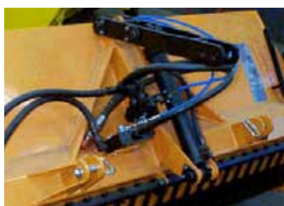
Hydraulisk ventil for dosering af spredemateriale.