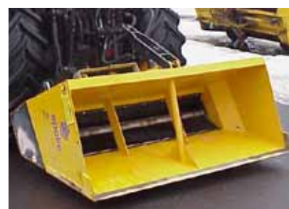
Epoke doseringssystemet kan udlægge både sand, salt, split, urea, kemikalier, olieabsorba, kunstgødning etc.

Epoke® A/S Vejenvej 50, Askov DK-6600 Vejen Tel. +45 76 96 22 00 Fax +45 75 36 38 67 epoke@epoke.dk www.epoke.dk