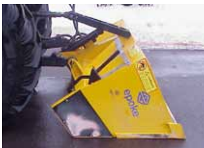
Ved montering af PSL 6,5 låses liftarme i viste position. Herefter hejser en cylinder PSL 6,5 til spredeposition.