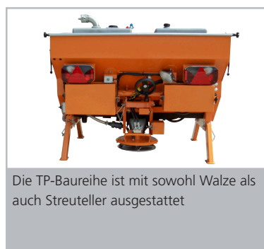
Die TP-Baureihe ist mit sowohl Walze als auch Streuteller ausgestattet