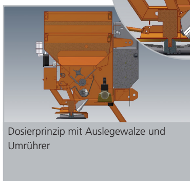
Dosierprinzip mit Auslegewalze und Umrührer